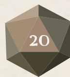
Veinte caras (D20)