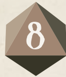
Ocho caras (D8)