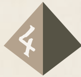
Cuatro caras (D4)