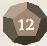
Doce caras (D12)