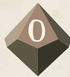
Diez caras (D10)