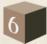
Seis caras (D6)